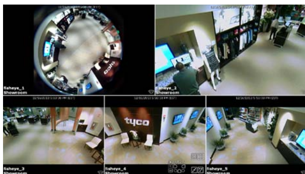
イラストラ 825 魚眼カメラの平面補正後の複数映像

* Includes double gang box/mount adapter plate